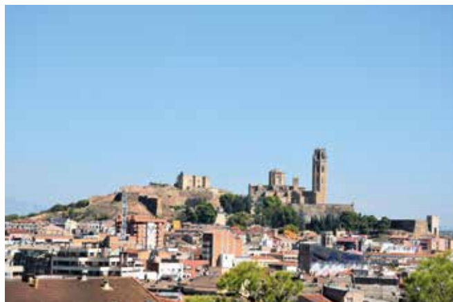
Des de l'est, la silueta del gran tossal, amb el seu poderós patrimoni monumental, destaca en la plana lleidatana.

Alguns membres de la Universitat de Lleida han participat i participen en accions vinculades a l'estudi i la difusió de la realitat complexa del Turó de la Seu