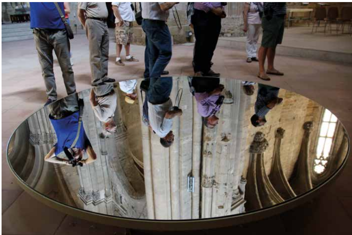
Bonica fotografia de la classe pràctica del curs sobre capitells de l'any 2017.

banda, de vinculades a la recerca, com ara la realització de dos congressos interdisciplinaris previstos, el primer —si pot ser—, per a la primavera del 2022, i el segon, per a finals del 2024; seminaris anuals de formació en els diferents àmbits temàtics; seminaris anuals de preparació i discussió sobre els temes que s'han de