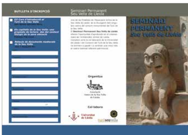
Fulletó del darrer Seminari Permanent Seu Vella de Lleida, un precedent de la càtedra.