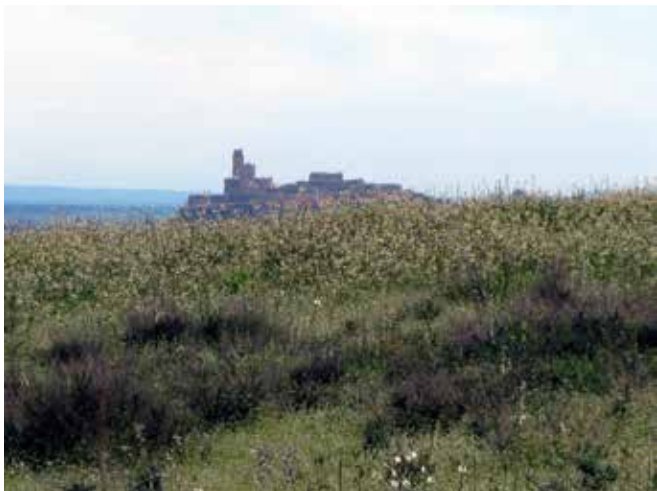
Des de Gardeny es veu tot el conjunt singular per sobre de la ciutat: Castell del Rei, Seu Vella i la fortalesa moderna.