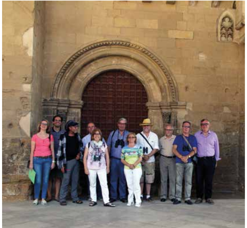
Alumnes i professor del curs sobre capitells de l'any 2017.

Esperem, doncs, que aquesta iniciativa es concreti aviat i, així, puguem començar, entre altres objectius, a reforçar els arguments per poder convèncer la Humanitat —perquè nosaltres ja n'estem, de convençuts— que una de les seves joies patrimonials és a Lleida i que es diu "Turó de la Seu Vella". Perquè, entre altres coses, i com ja és prou conegut, va ser des d'aquest turó que el rei Pere el Cerimoniós, conscient del lloc on es trobava, valorava al segle XIV l'Acrópoli, la d'Atenes, com una e les joies patrimonials de la Humanitat. I era el primer cop que es feia.