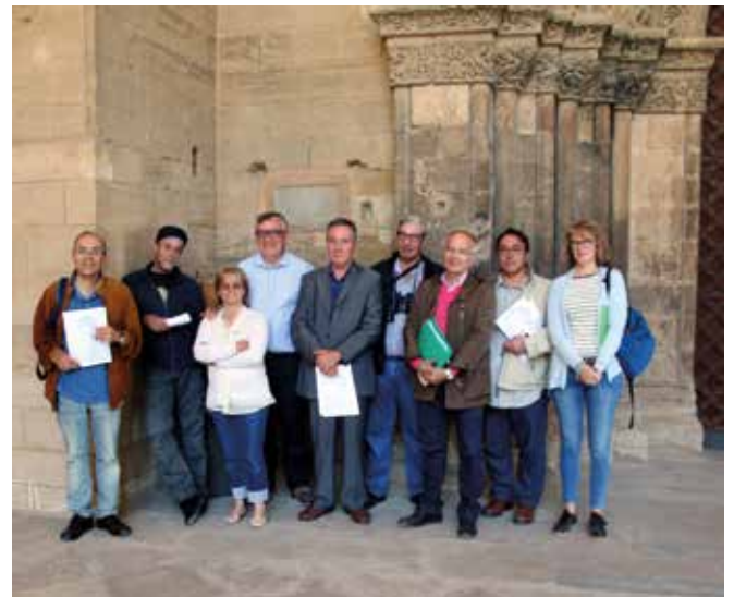
Alumnes i professor del curs sobre epigrafia de l'any 2017.

La càtedra tindrà una durada inicial de 4 anys, a partir de la primavera propera. Aquest és el període de temps pel qual les empreses i les institucions patrocinadores es comprometran amb la Universitat; algunes ja s'hi han compromès, i diríem que són les “fundadores” d'un projecte que ens ha d'il·lusionar a tots.