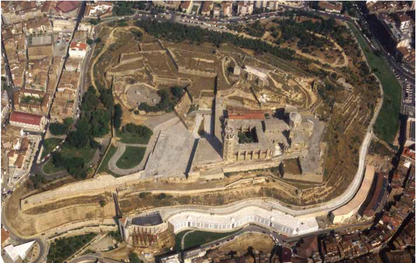
El conjunt monumental del Turó de la Seu Vella.